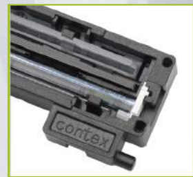
Contex CleanScan CIS