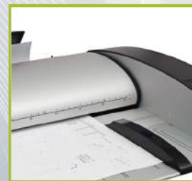
راهنمای قراردادن اورجینال