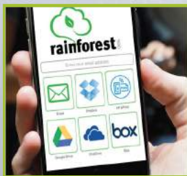
سرویس Cloud با نرم افزار Rainforest365