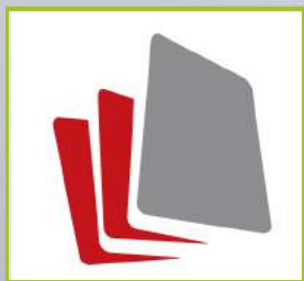
عضوی از گروه کاری

تکنولوژی منحصر بفرد: با ماژول های Contex CleanScan CIS، شبکه پرسرعت، نرم افزار پیشرو NextImage، اسکنر IQ Quattro، یک اسکنر برتر در پروژه های مهندسی و فنی میباشد