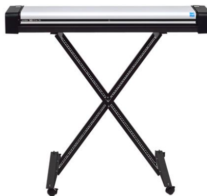
نگهدارنده دستگاه یا Stand